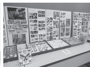
「ちようちよ」標本・関連図書展示の様子