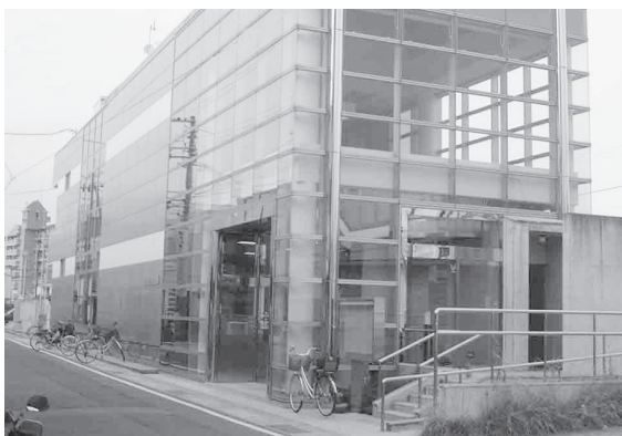
▶駅前ライブラリー