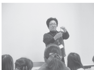
「毛糸でシュシュづくり」の様子