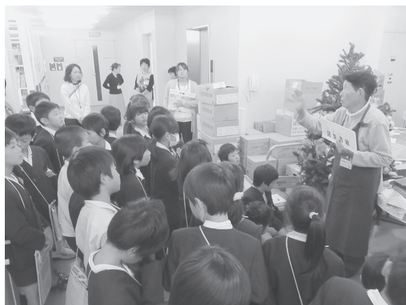
「インフォメーショングループの案内による 岩出小学校3年生図書館見学」の様子