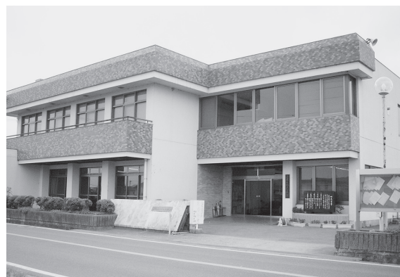
◀上岩出地区公民館