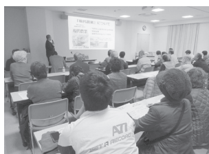
「野菜づくり講習会」の様子