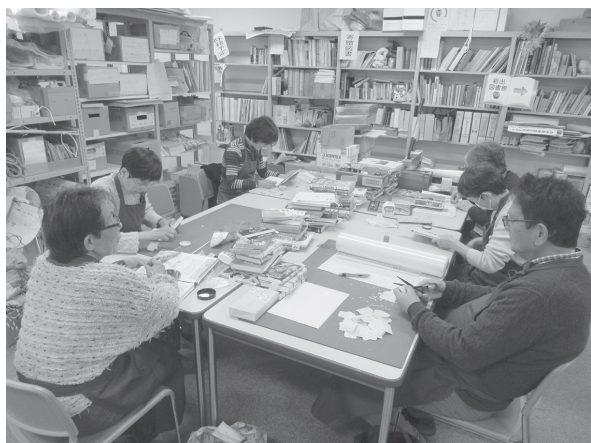
「補修グループの作業」の様子