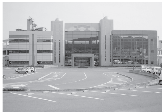
◀総合保健福祉センター