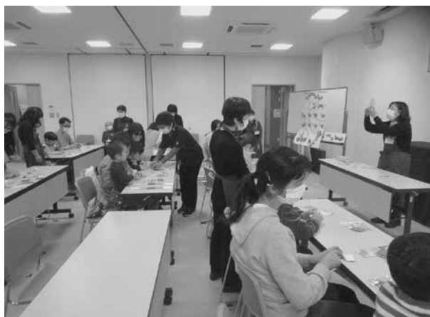
おはなしドロップス「自分だけのあおむしをつくろう」の様子