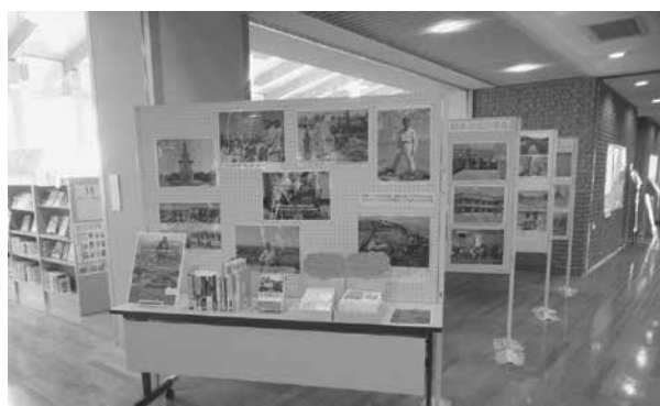
「人権パネル展 中村哲医師 活動記録写真展」の様子