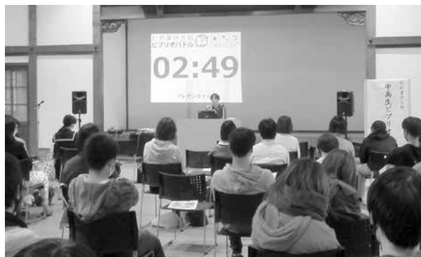
「中高生ビブリオバトル 岩出市大会」の様子