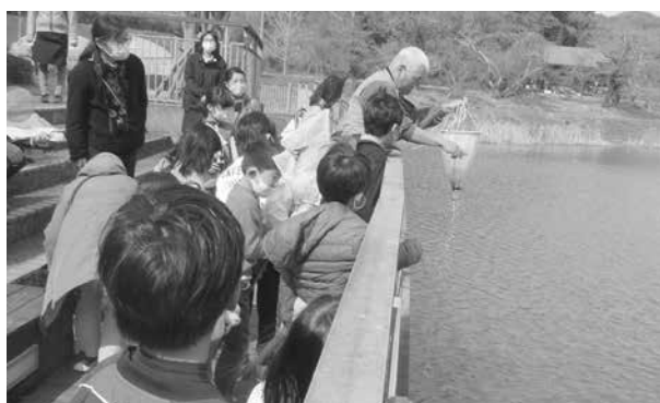
「われら!!生き物調査隊」の様子