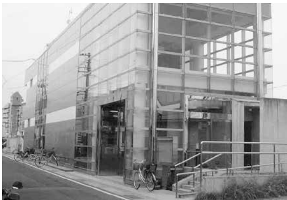
▶駅前ライブラリー