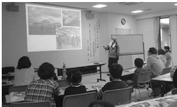
「図書館講座 トゲネズミみつけ隊」の様子