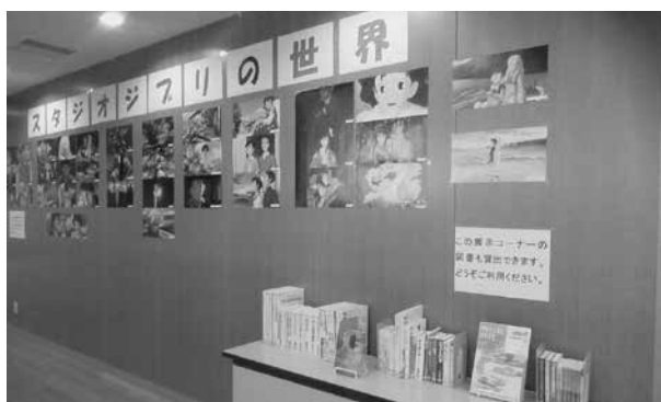
「スタジオジブリの世界」の様子