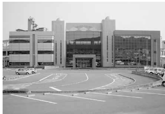
◀総合保健福祉センター