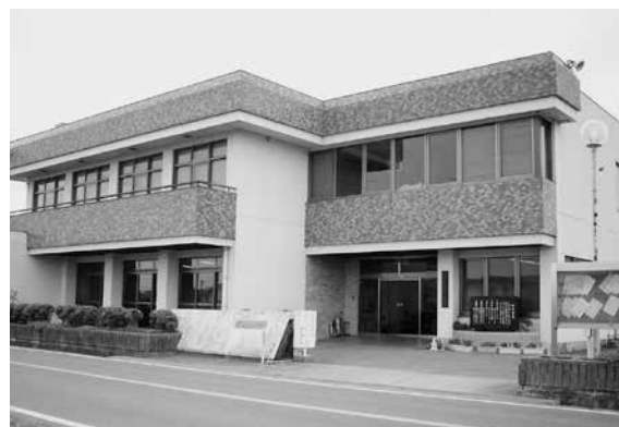
◀上岩出地区公民館