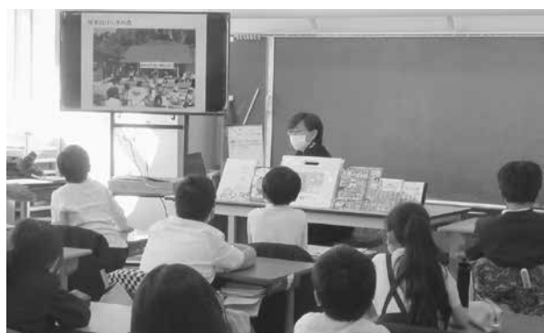
「岩出小学校出前授業」の様子