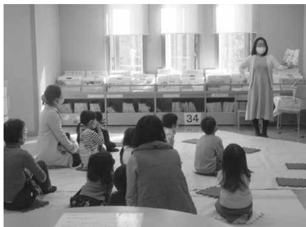
「英語でおはなし会」の様子